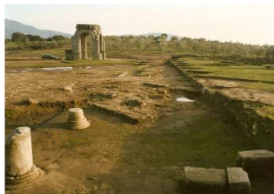
Foto 3 Galería porticada