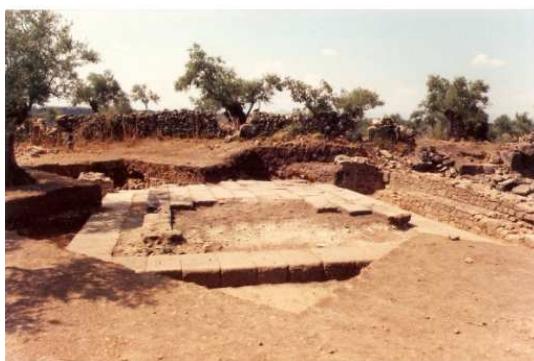
Foto 4 Plataforma del templo