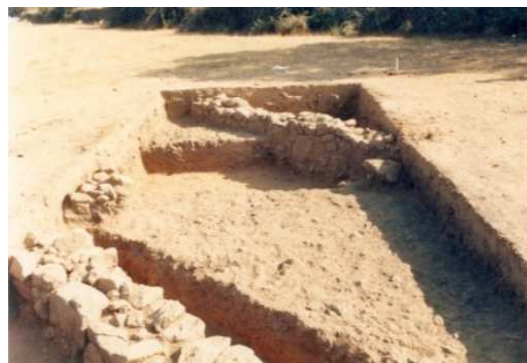
Foto 5 vivienda sector D9

En el sector D9, a 99 mts, del arco, junto a la antigua carretera, se llevó a cabo una cata para determinar si conservaba alguna estructura, quedando al descubierto los muros de una vivienda (foto,5). En el sector H6, H7, se realizaron varias catas, unas para establecer las características de la muralla y otras que aclararon correspondían a los muros de viviendas.(foto 6).